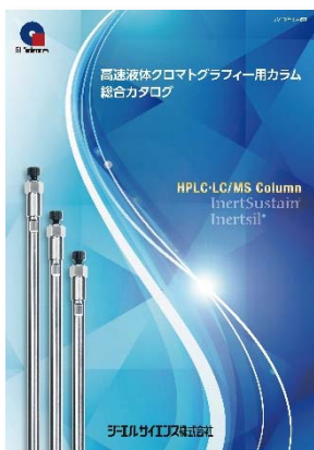
高速液体クロマトグラフィーカラム総合カタログ

InertSustain、Inertsilの詳細については、弊社ホームページをご参照いただくか、「高速液体クロマトグラフィーカラム総合カタログ」の送付をご依頼ください。