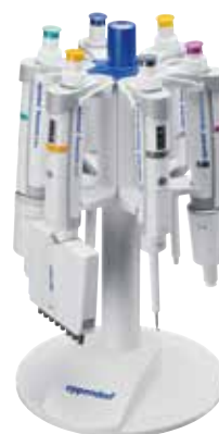
ピペットスタンド6本架 (リサーチプラス用)

リサーチプラス用スタンド (アダプター) はリサーチシリーズ、リファレンスシリーズにも対応しており、お使いの各種ピペットを整頓してご使用いただけます。