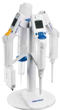
Xplorer用充電スタンド4本架