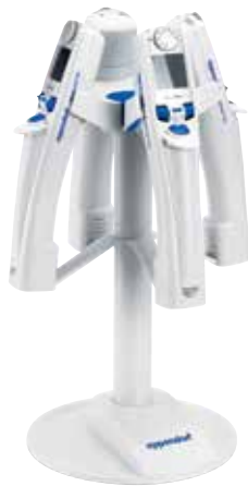
マルチピペットチャージャーシェルで 電動のMultipetteシリーズに対応

Eppendorf Xplorer / Xplorer plus、Multipette E3 / E3xに対応した充電スタンドです。充電したままスタンドに架けておけるため、充電された状態ですぐに使い始めることができます。