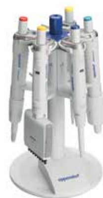
ピペットスタンド6本架 (Reference2用)