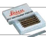
TC-65 タングステンブレード (5枚/組)